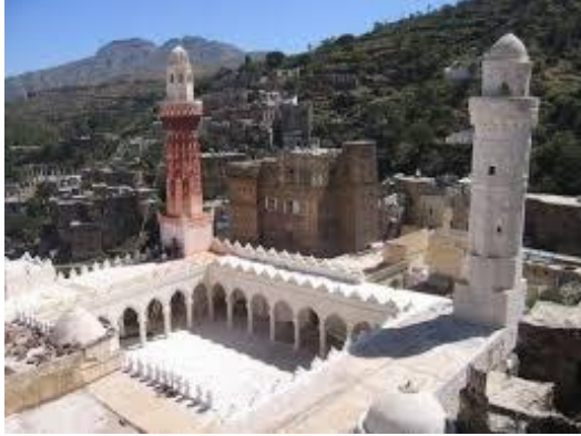
جامع جبلة التاريخي