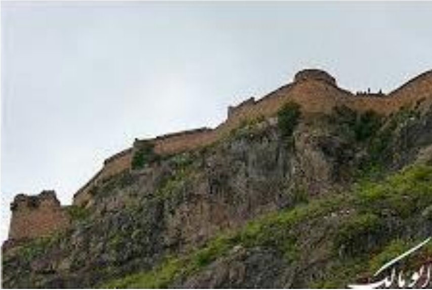
منظر لحصن حب من أسفل جبل بعدان