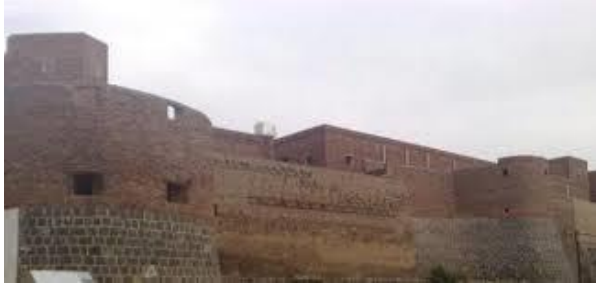
قصر غمدان في شعوب صنعاء القديمة والمسمى حاليا دار السلاح