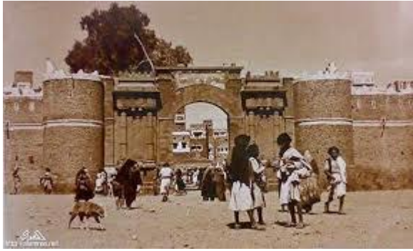
سور صنعاء القديمة وباب اليمن