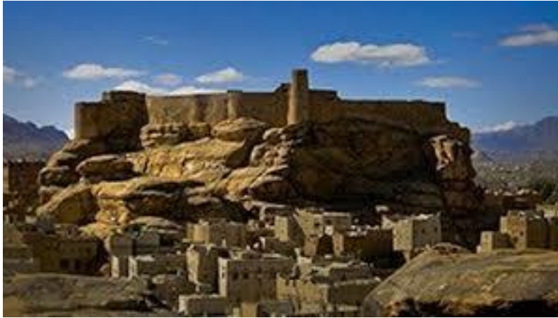
قلعة رداح التاريخية من الجهة الجنوبية