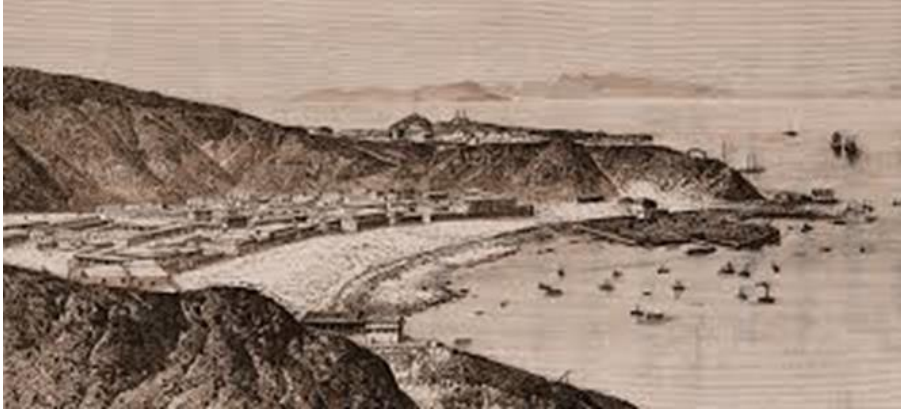
لوحة فنية تصور مدينة عدن قديماً

سابعاً: رفع الظلم عن أهل عدن: أزال الملكين بعد توليهما شئؤون عدن المفسد التي كانت موجودة في عدن ورفع الظلم الذي كان واقعاً على أهل عدن.