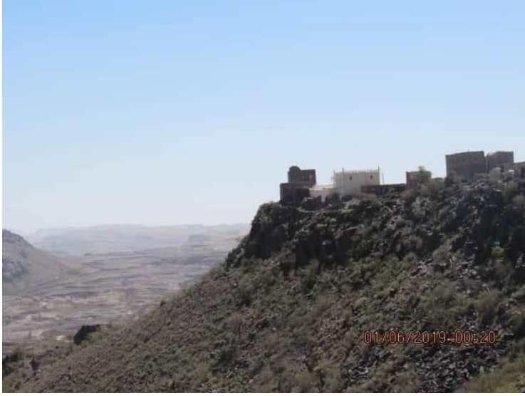
المقرانة عاصمة الدولة الطاهرية وتبدو بعض الأطلال القديمة

وممن قال من الباحثين كذلك بأن المقرانة كانت عاصمة الدولة الطاهرية الباحث عبدالمجيد الدرة فقال: "المقرانة حصن وبلدة أثرية في عزلة حجاج من مديرية جُبن وأعمال رداع، اتخذها سلاطين بني طاهر عاصمة لدولتهم" 1 .