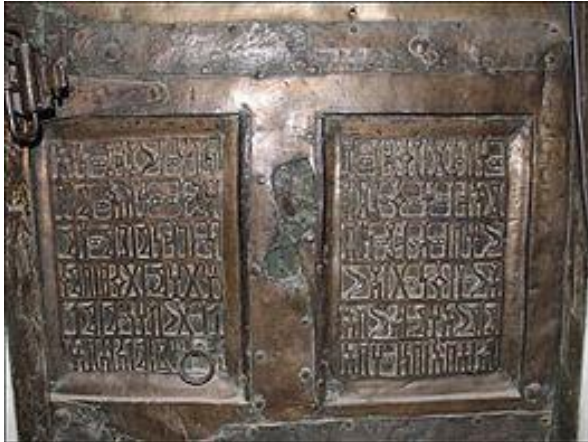
لوحة بالخط المسند في بوابة قصر غمدان بصنعاء