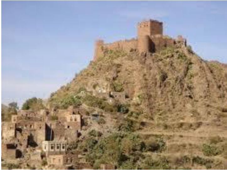
قلعة الدُملوة في مديرية الصلو تعز