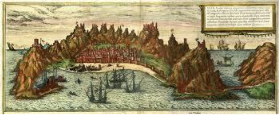
لوحة فنية تقريبية لبناء عدن في العصر القديم

ثم إن الملك عامر بن طاهر تراجع عن إسناد إمارة الشحر لجياش السنبلي، وردده عن ذلك، وقال: لا أرتضيه وأني أخاف منه الخلاف وأن يقبض خراجه ولا يؤديه ١ . ومما يُروى أن أبا دجانة لما وصل إلى فوق بندر عدن، خاف أهل البلد من دخوله للبلد، لأن غالب عسكره أوباش مُجَمَّع، فرأى بعضهم في النوم كأن باب الساحل مفتوحاً، وأن الشيخ مُجَدِّ بركة الجبرتي ماداً ذراعيه بين البابين، وطالت ذراعه حتى بلغت من الباب إلى الباب كالمنايع للناس من الدخول، فأصبح يخبر الناس بذلك ويشهرهم بالأمان ٢ .