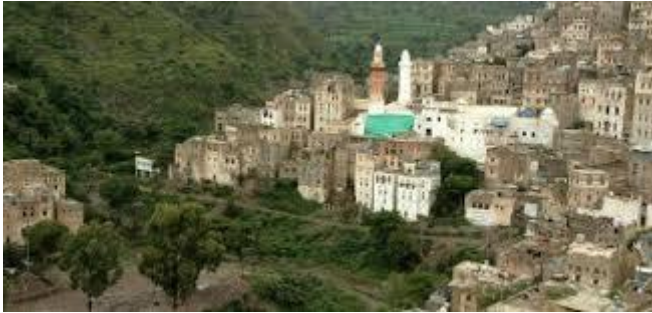
مدينة جبلة التاريخية