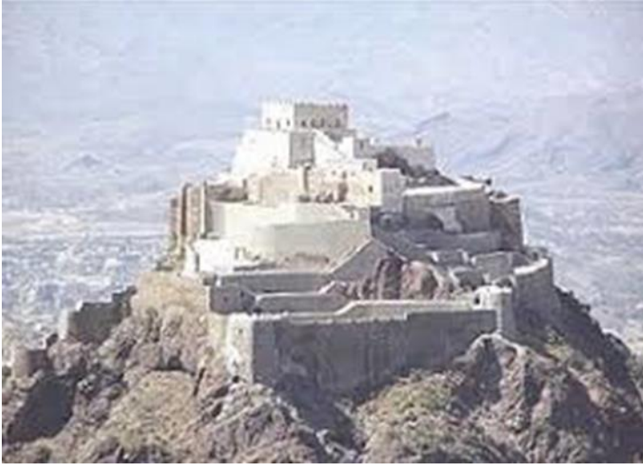
قلعة القاهرة في جبل صبر بتعز