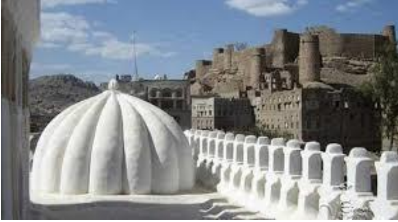
منظر لقلعة رداح من وسط المدينة الجهة الشمالية من جهة مدرسة العامرية