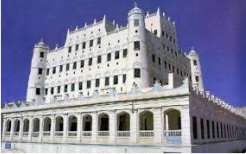
قصر السلطان الكثيري في سينون

وفي كلا الحالتين فإن السلطان بدر بن مُجَّد الكثيري كان أول حاكماً للشحر من بني كثير، وكان ذلك بداية سلطنتهم على الشحر، وذلك بكتابة عهد الولاية له من الملك الظافر عامر بن طاهر في سنة ٨٦٧هـ.