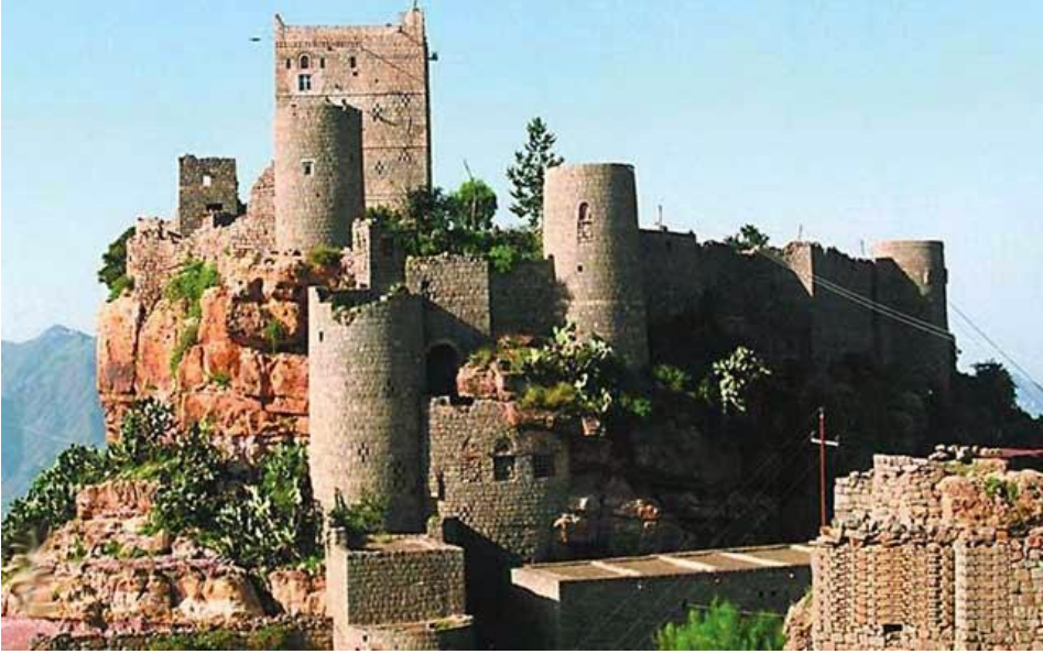
حصن تلا في مدينة تلا بالمحويت