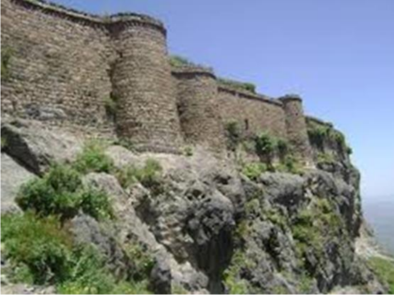
حصن حب في جبل بعدان محافظة إب