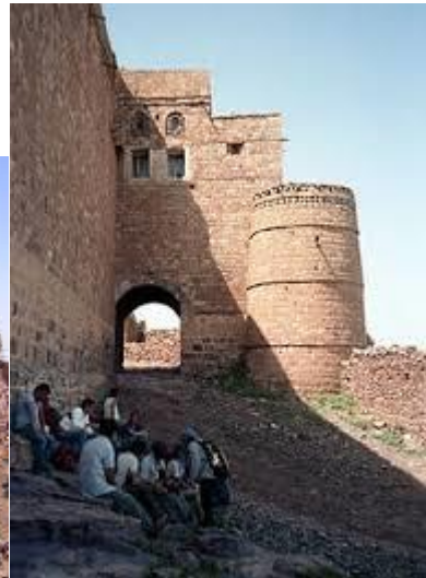
حصن كوكبان ومدينة كوكبان الأثرية بالمحويت